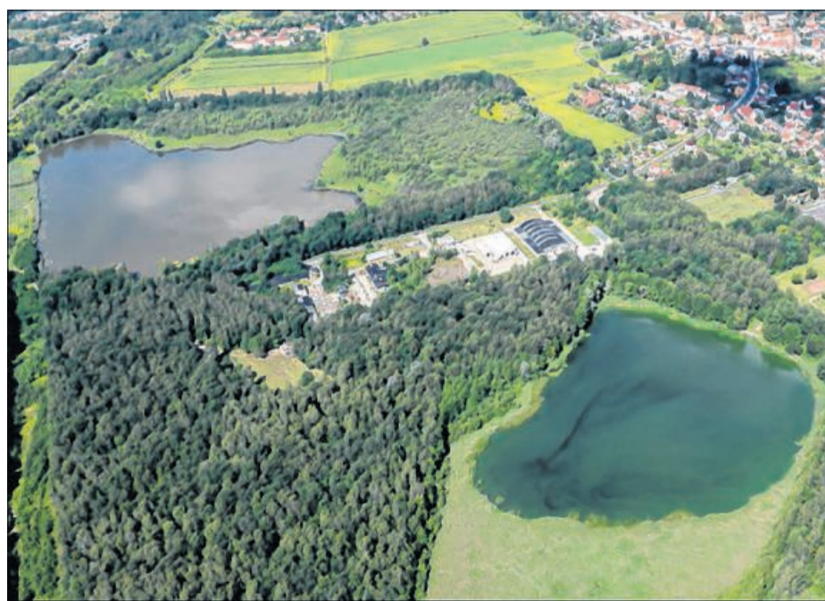
Eine Verkehrsumleitung erfolgt dementsprechend. (Foto: Archiv LMBV / RL 38 im oberen Bildbereich; RL 35 im unteren Bildbereich).

Der 1. Bauabschnitt beinhaltet die Teilberäumung einer Altlastenfläche im Nordosten. Daran schließt sich die Sicherung der Ostböschung durch Rütteldruckverdichtung an. Zu dieser Maßnahme gehören die Holzung/Rodung des Arbeitsbereiches und die abschließende Uferprofilierung. Die Arbeiten erfordern die Vollsperrung der Ortrander Straße. Der 2. Bauabschnitt beinhaltet die Herstellung der erforderlichen Wassertiefen im Restloch und der Trittsicherheit der Nord- und Westböschung. Aus Gründen der Sicherheit für die Arbeitnehmer darf der 2. Bauabschnitt erst nach Abschluss der Rütteldruckverdichtung begonnen werden. Vorbereitend für diese Arbeiten müssen die Medienleitungen im Bereich der Ortrander Straße temporär verlegt werden.